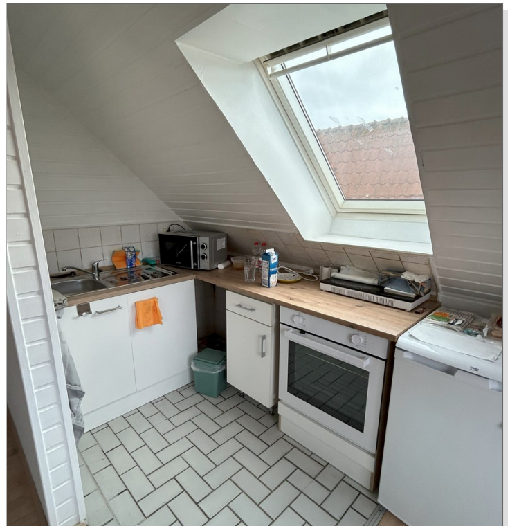
Wohnung DG 2